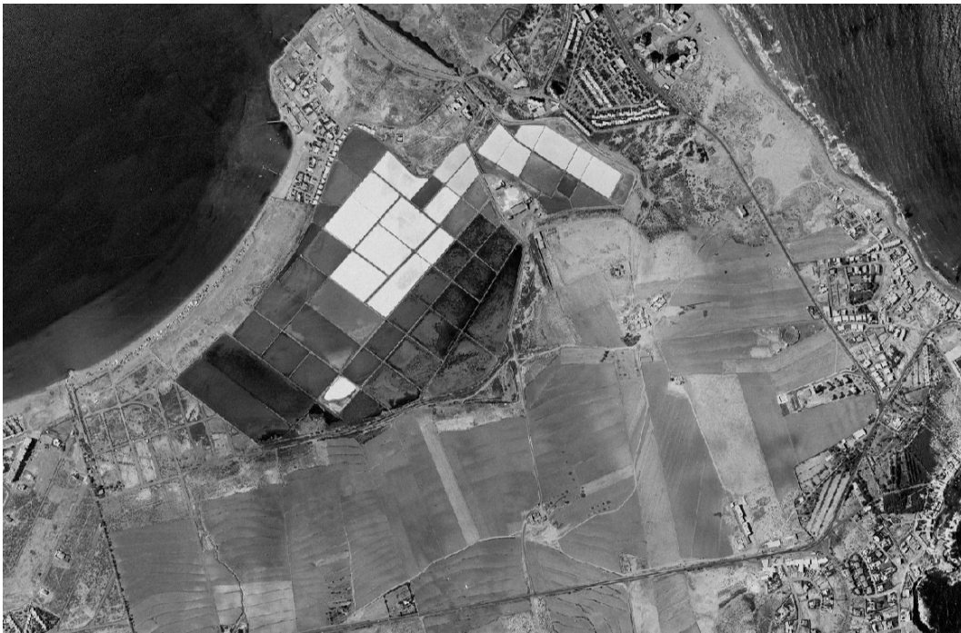
Foto aérea del año 1981.