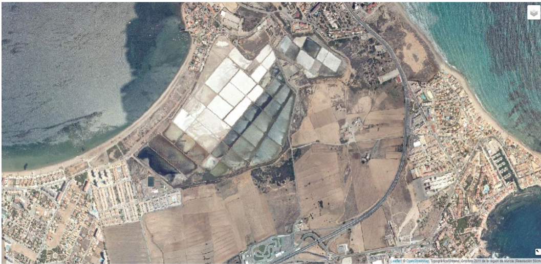
Foto aérea año 2011.