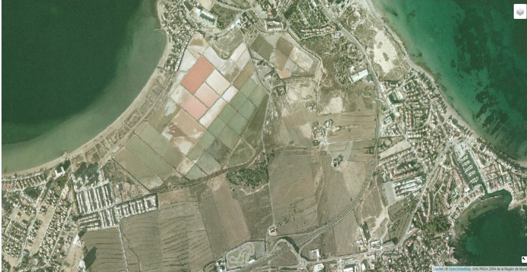
Foto aérea del año 2004.