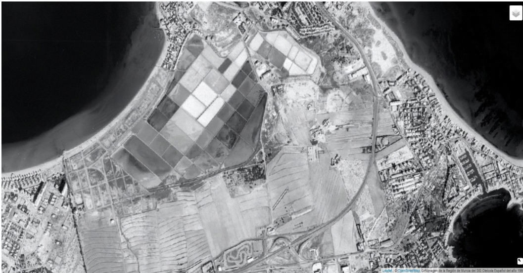
Foto aérea del año 1997.