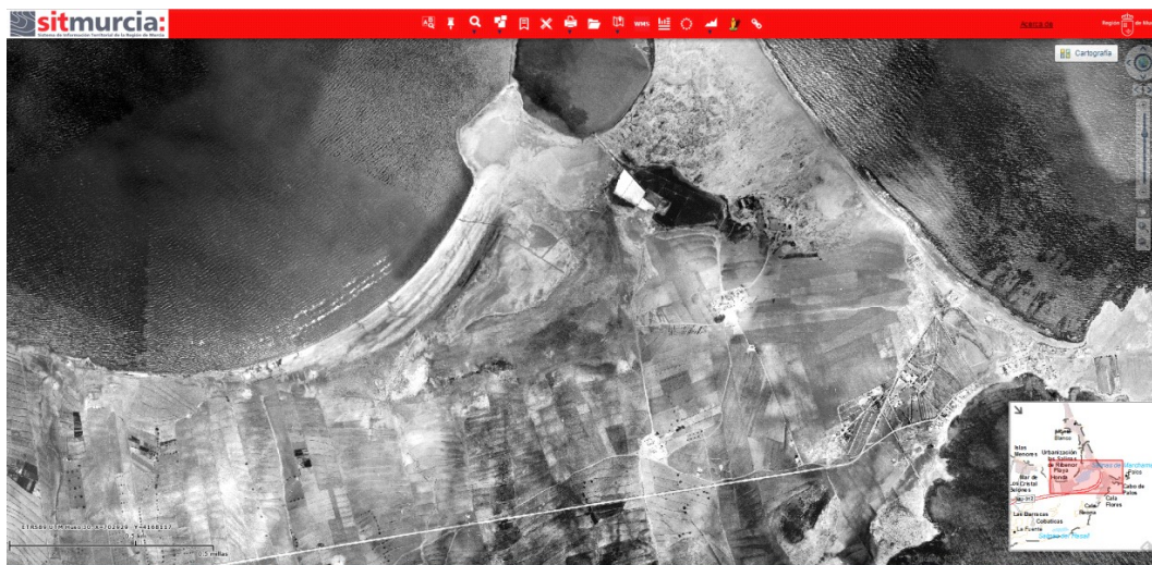
Foto aérea del año 1929.

Según fotos aéreas históricas son caminos que se adaptaron para el mantenimiento y explotación de las Salinas de Marchamalo (foto aérea año 1956), pero que con el paso del tiempo (foto aérea año 1981) se han convertido en caminos de uso público que comunican los núcleos poblacionales de: Playa Paraíso, las viviendas ubicadas en el Polígono de la playa de los Alemanes, así como las viviendas ubicadas en el sur de La Manga y el núcleo poblacional del Paraje de Las Triolas, con gran afluencia de Tráfico en época estival, siendo su uso habitual e indispensable para la vida de los vecinos de esta zona.