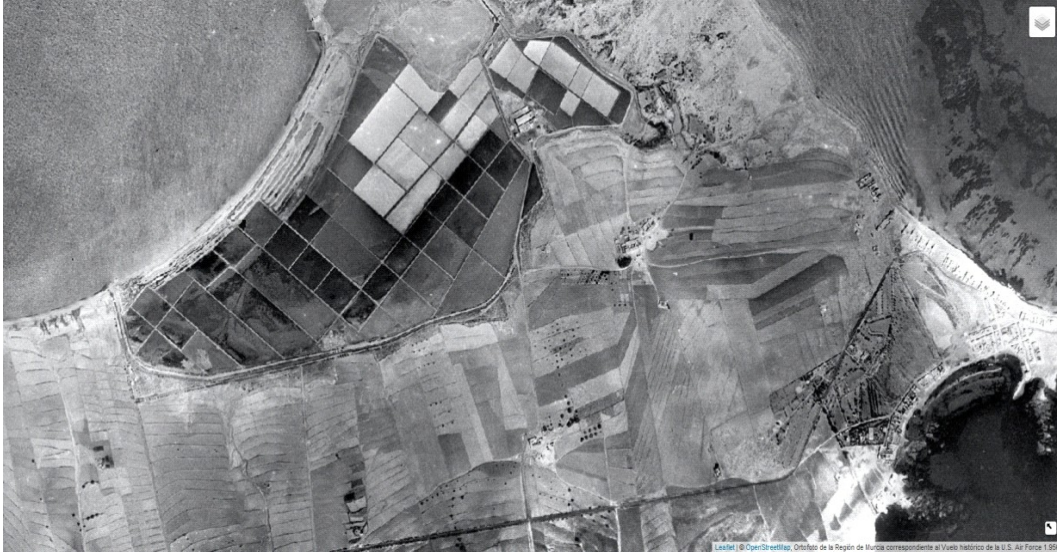
Foto aérea del año 1956.