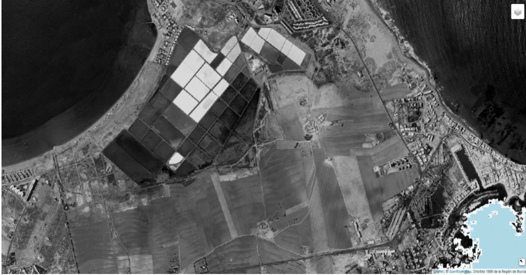
Foto aérea del año 1986.