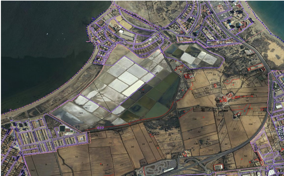
Foto aérea actual. Ortofoto de máxima actualidad del proyecto PNOA con catastro.

Foto aérea del año 2013.