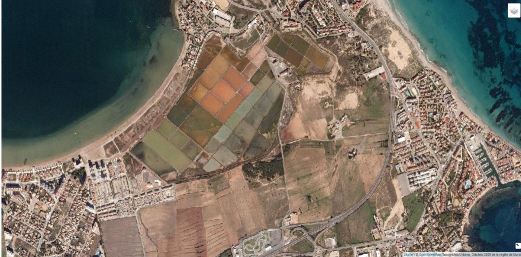
Foto aérea año 2009.