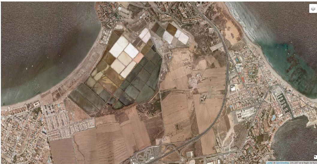
Foto aérea del año 2007. (Fuente OpenStreetMap, Ortofoto 2007 de la Región de Murcia).