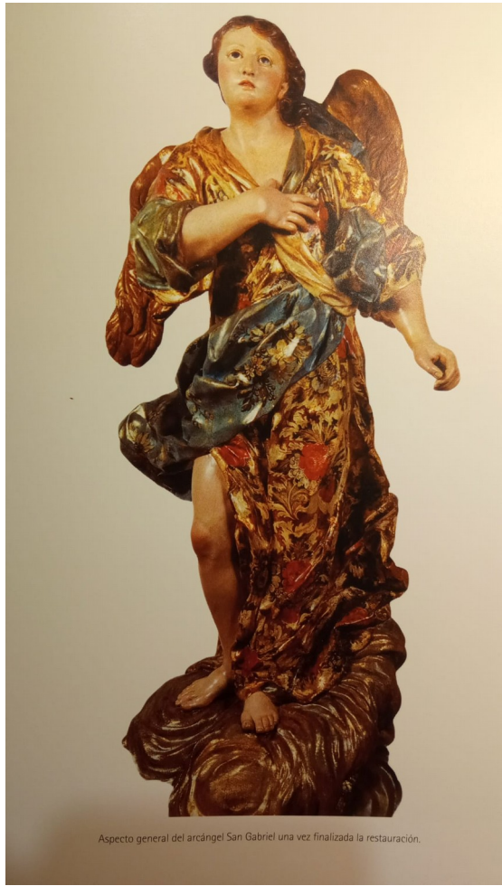
Aspecto general del arcángel San Gabriel una vez finalizada la restauración.